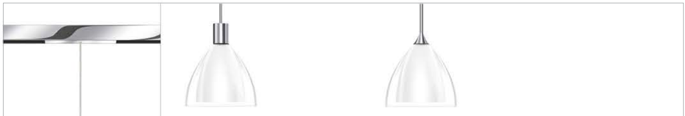
SILVA 160 G9 ALL-IN