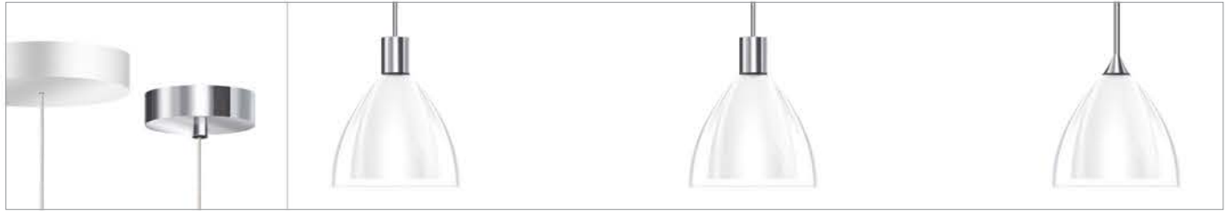
SILVA 160 G9 S